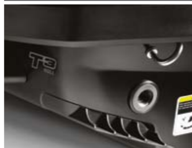
ABAS DE TRIM