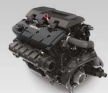
MOTOR ROTAX® 1630 ACE™

Tipo T 3 • Plataforma média • Casco em V profundo para águas turbulentas • Melhor inclinação e curvas precisas