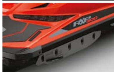
ESTABILIZADORES TRASEIROS AJUSTÁVEIS